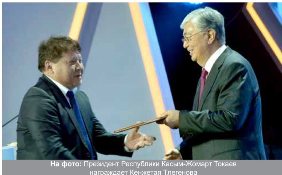
На фото: Президент Республики Касым-Жомарт Токаев награждает Кенжетая Тлегенова

ми и передовыми практиками в нефтяной сфере. И напомнил, что сегодня национальная компания «Казмунайгаз» успешно реализует крупные проекты с такими корпорациями, как Chevron, ExxonMobil, Shell, Лукойл, Eni, Total, CNPC и другими.